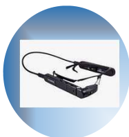
AceREAL 3 ++.z+z3+A あzg6vb (ウェアラブル遠隔支援)

現場作業者の目線を本部及び複数現 場で共有。現場作業の効率化、生産 性の向上を実現します。