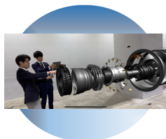
DataMesh Director (XRコンテンツ生成)

XRコンテンツを簡単に撮影および投影 できるため試作品製作や商品化までの リードタイムを短縮できます。