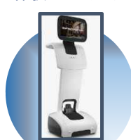
temi (遠隔操作・映像ロボット)

複数のセンサーとAI及び映像伝送 を搭載したロボティクスソリューション を体験いただけます。