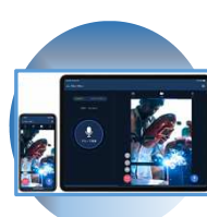
Buddycom (映像コミュニケーション)

一斉通話、映像配信、会話履歴など スマートフォンやタブレットで現場コミュニ ケーションを支援します。