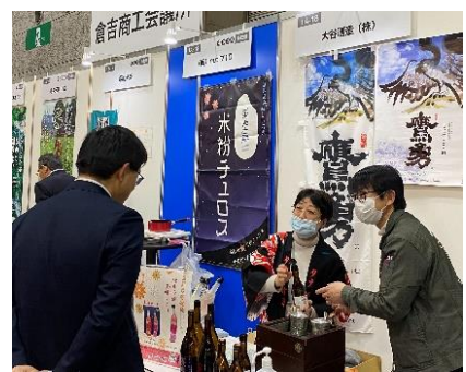
昨年度出展した FOODSTYLE Kansai (インテックス大阪) の様子