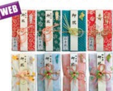
写真 上段:手ぬぐい 下段:ガーゼ生地

◆価格: 各600円(税込・送料別) ◆内容: 手ぬぐい(33×90cm)、内封筒、帯紙(寿と無地の2枚入) ガーゼ生地手ぬぐい(33×90cm)、内封筒、帯紙(御出度御祝と無地の2枚入)